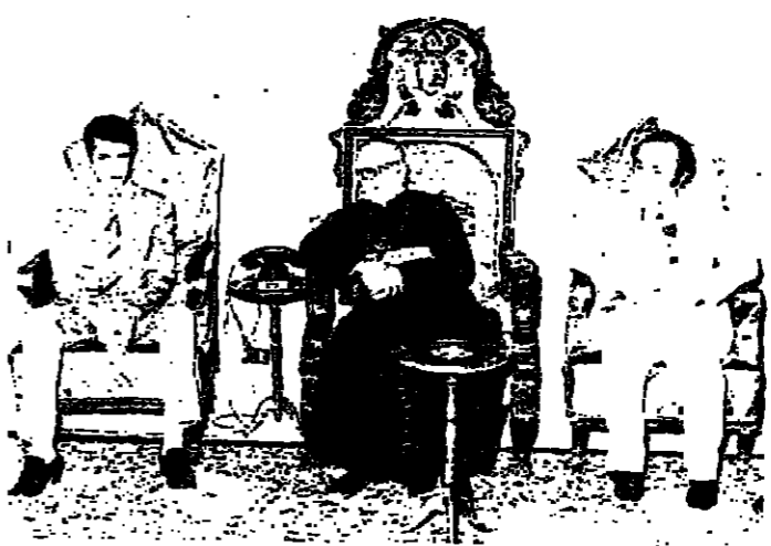
البيطريك خريش لدى استقباله الوند، ويبدو النائب واكيم